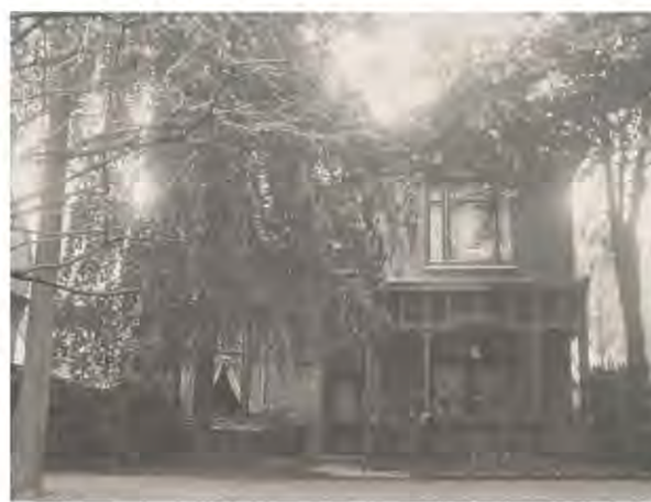
Lagendijk 56 kort na de bouw, en het huis in 2023.