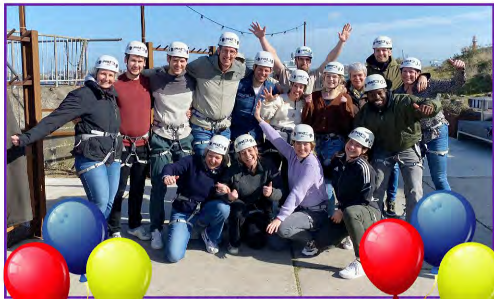
Enthousiaste Sminia team in feeststemming.