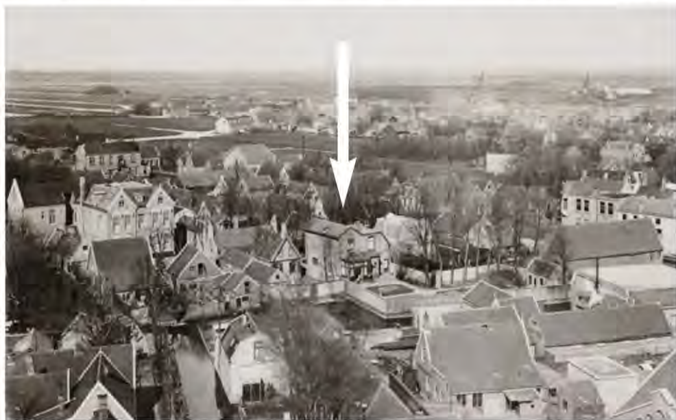
1915, panorama van Koog aan de Zaan vanaf de silo van Duyvis Oliefabriek. Op de voorgrond rechts Machinefabriek P.M. Duyvis, daarachter het huis en de L-vormige tuin met schuur aan Lagendijk 56.

Kostentechnisch besluit Royal Duyvis Wiener in 2018 het onroerend goed dat niet direct verband houdt met de bedrijfsvoering af te stoten. Daartoe behoren o.a. de huizen aan de Lagendijk 50 en 56. ■