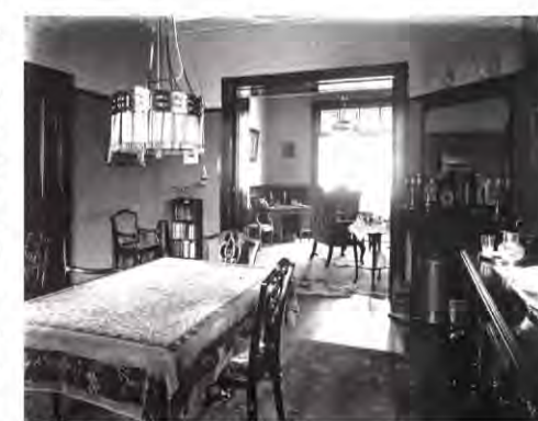
Foto genomen vanuit de achterkamer. Zichtbaar zijn de plafondornamenten die nog altijd aanwezig zijn. De openslaande deuren naar de veranda en het kozijn met de boog in de zuidelijke muur zijn later gewijzigd.