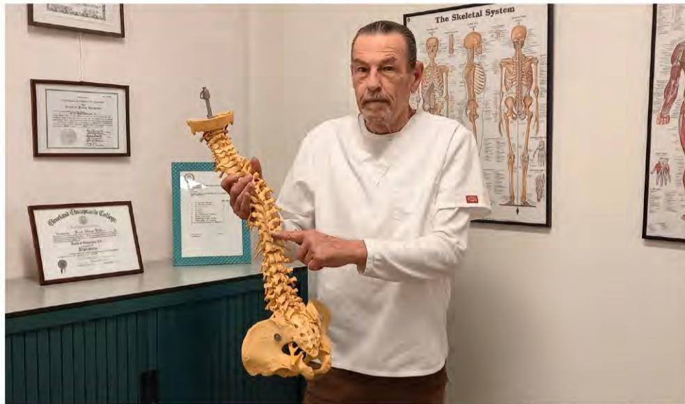
Dr. Kev legt de vinger op de zere plek... "Geef ruggen leven... en levens terug".