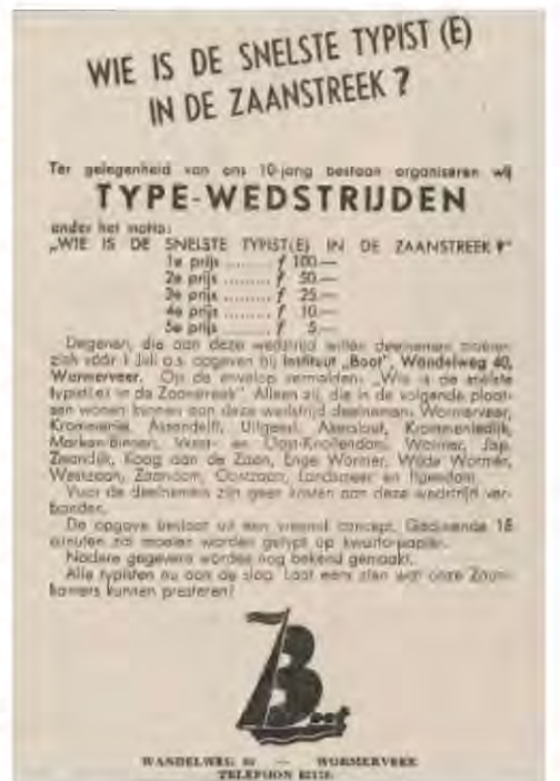
Advertentie Instituut Boot in De Zaanlander - 19 juni 1948

Wat ik ook heel veel gedaan heb was gymnastiek. Ik heb heel veel diploma's gekregen. Altijd op Simson. Dat bestaat helaas ook niet meer. Half Koog en Zaandijk zat bij Simson op gymnastiek natuurlijk. Gymnastiek deed ik vanaf heel vroeg, een jaar of 8 al. Ik heb ook altijd aan wedstrijden meegedaan, vandaar al die diploma's. Ook wed-