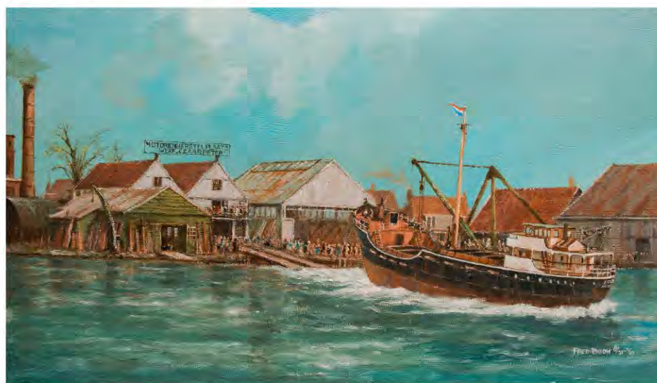
Zaanlandse scheepsbouw met Erna. Olieverf schilderij. (uitsnede)

In de kerk kunt u heerlijk even koffie drinken en lekker bijpraten. De opbrengst gaat naar het restauratiefonds van de kerk. Tot 9 december!!