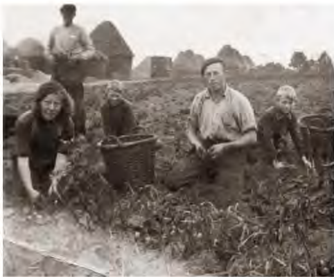
Fotobron annetgorter.blogspot.com/2013: Aardappel rooien - 1939

christelijk uit die contreien daar. Maar dat was wat: mijn broer en ik gingen naar een openbare school. Mijn vader was wat dat betreft toch een beetje het zwarte schaap van de familie.