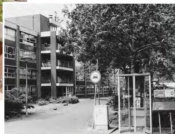
Telefooncel en postbus op de Tuinstraat

Vier beheerders hebben in de loop der tijd het Gortershof onder hun hoede gehad en