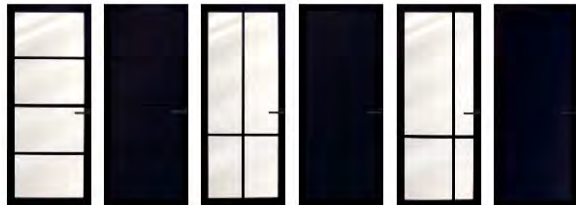
NERO LEGNO Oltari met blank vlak glas NERO LEGNO Desto NERO LEGNO Bres da met blank vlak glas NERO LEGNO Elba NERO LEGNO Asti met blank vlak glas NERO LEGNO Foggia

Zuideinde 44 • Koog aan de Zaan • T: 075 - 617 69 45 • www.bbhal.nl