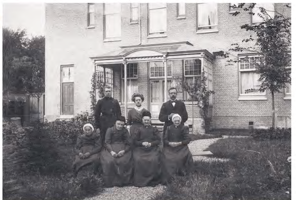
Achtergevel, een aantal bewoonsters en personeel in de tuin aan achterzijde.

Naast onze eigen uitgaves hebben we ook een sortering 2e hands Zaanse boeken liggen. Opbrengst voor de verenigingskas. De boeken en magazines zijn verkrijgbaar bij Chocolaterie De Cacaoboom, Lagedijk 142b te Zaandijk. De wandel/fietsroute is ook verkrijgbaar bij Drukkerij De Top in Koog aan de Zaan.