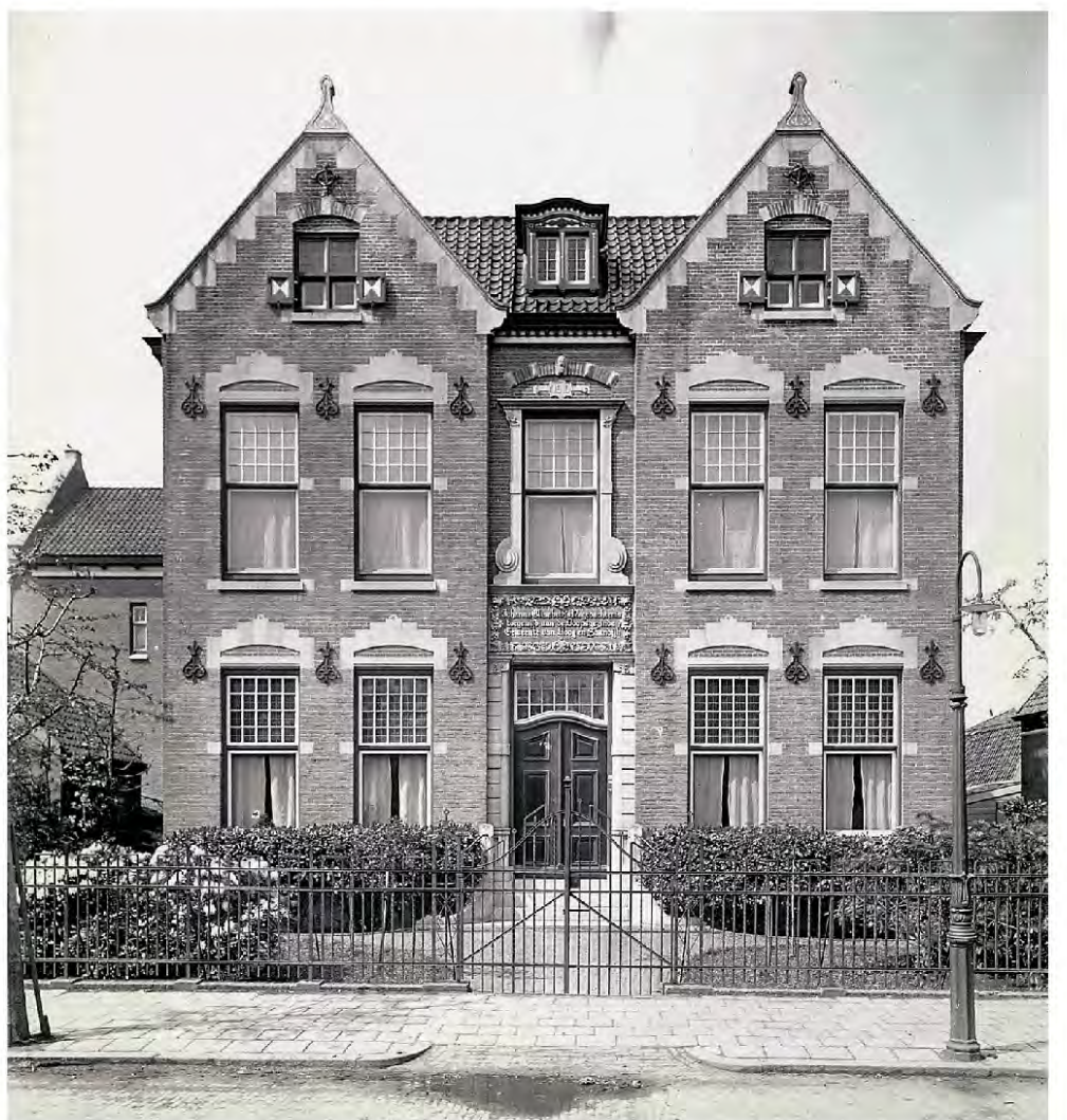
De Johanna Elisabeth Stichting.