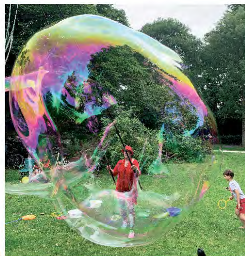
La Belle Dame maakt de grootste bellenblaas bellen die je ooit hebt gezien!

Op het Kerkplein komt ook de prachtige La Belle Dame sprookjesachtige reuze bellen blazen en verzorgt RSK-Sound een muzikale omlijsting. Er kunnen ongetwijfeld verzoekjes ingediend worden. Een goede muzikale sfeer is in elk geval verzekerd. Het terras, waar heerlijke kazen, hapjes, wijnen, bieren en drankjes genuttigd kunnen worden brengt ons weer terug in de vakantiestemming. Kortom: gezelligheid en vertier ten top, kom dus allemaal genieten met elkaar en maak er een superfijne dag van!