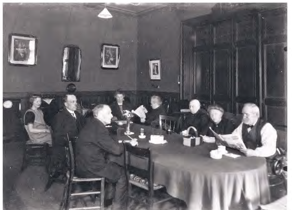
Bewoners, dienstster, de weesvader en -moeder (2e en 4e van links) in de algemene zaal.

In 1919 bleken de gevolgen van de inmiddels beëindigde oorlog nog altijd merkbaar: voor buitenschilderwerk van het huis was geen geld meer. Een onverwacht legaat bracht uitkomst. Ook de door derden intensief gebruikte catechisatieruimte leverde het een en ander op.