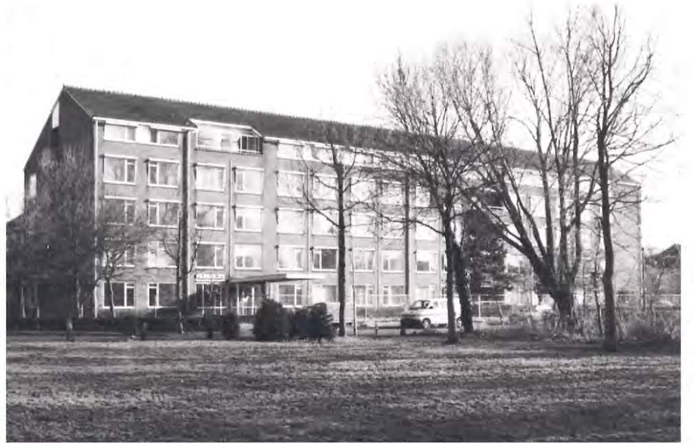
Het nieuwe bejaardentehuis 'Parkzicht'.