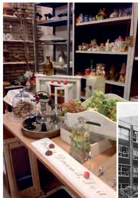
"Pronkies & Prulle", 2023

Is de titel van een boekje vol herinneringen over het jarige Gortershof in Zaandijk.