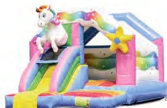
Ga van de glijbaan van het Unicorn-springkussen, superleuk voor de kleintjes.